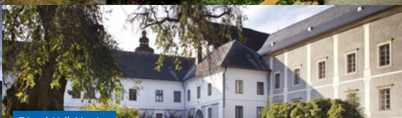
Zámek Velké Losiny